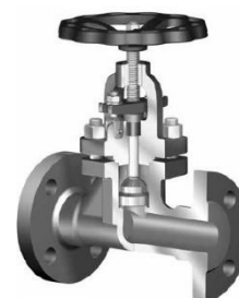
AT 1060A F