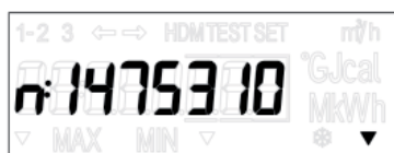
L1 L2 L3 Exempel: M-Bus sekundäradress