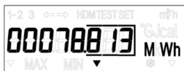
L1 L2 L3 Exempel: månadsvärde värme energi