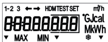
L1 L2 L3 Segmentstest